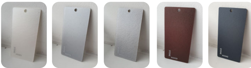
STONE 44401 - FACE MAT STONE 44410 - FACE MAT STONE 44411 - FACE MAT STONE 44420 - FACE MAT STONE 44440 - FACE MAT