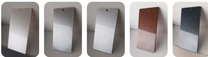
STONE 44401 - FACE BRILLANTE STONE 44410 - FACE BRILLANTE STONE 44411 - FACE BRILLANTE STONE 44420 - FACE BRILLANTE STONE 44440 - FACE BRILLANTE