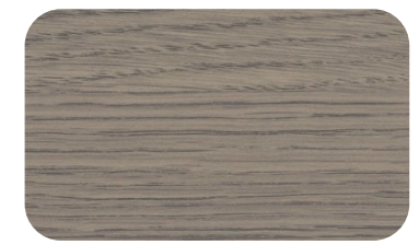
BOIS CLAIR - FW-1287