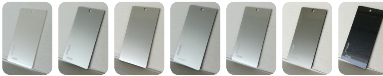
METALLIC 4084 METALLIC 8785 - FACE MAT METALLIC 8785 - FACE BRILLANT METALLIC 44785 METALLIC 4785 METALLIC 4789 METALLIC 4090