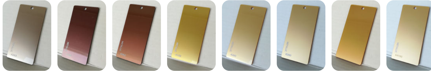
METALLIC 4263 METALLIC 4285 METALLIC 4262 METALLIC 4193 METALLIC 4260 METALLIC 8260 - FACE MAT METALLIC 8260 - FACE BRILLANTE METALLIC 44193