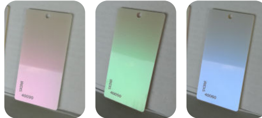
IRIDIS 40030 IRIDIS 40050 IRIDIS 40060